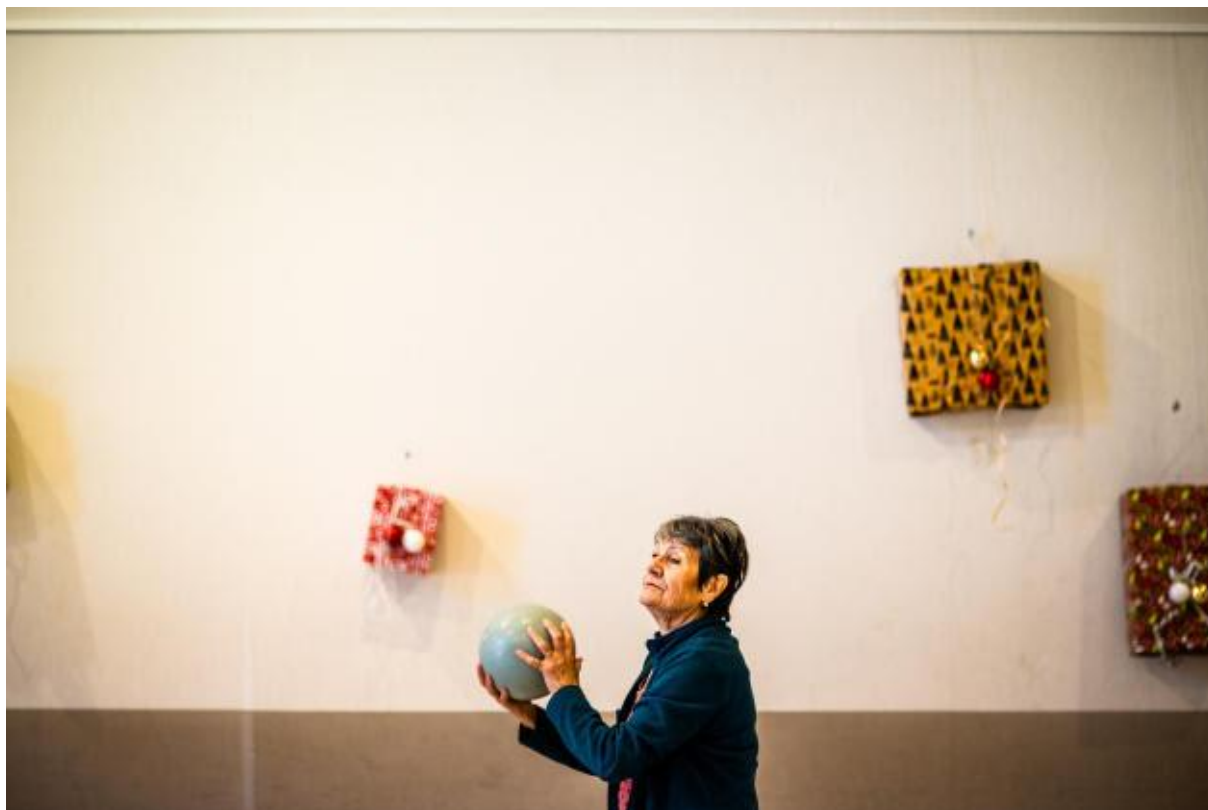
Travail de coordination avec un ballon, à Tresserre (Pyrénées-Orientales), le 24 janvier 2023.

Parmi ces villages, Bélesta, Le Vivier, Oms, Molitg-les-Bains et Serdinya-Joncet bénéficient de ce gymnase mobile, qui propose une trentaine d'activités, du sport collectif (basket-ball, football) aux jeux traditionnels (quilles catalanes, palet breton, tir à la corde).